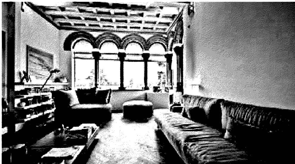
Appartamento in Viale Vittorio Emanuele II.