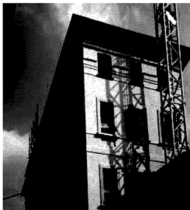
Il cantiere di Via Pradello.

Ritaglio stampa ad uso esclusivo del destinatario, non riproducibile.